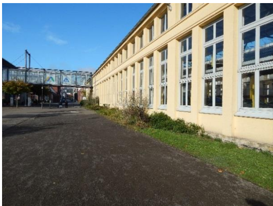
Abb. 7 Grünstreifen entlang des Jugendgästehauses mit vorgelagerter wassergebundener Wegedecke.