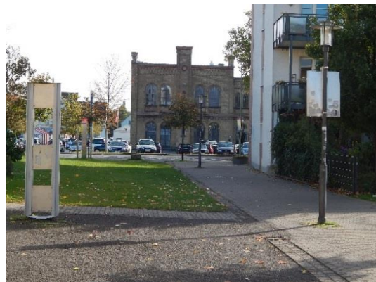
Abb. 8 Ende der Carl-Schmidt-Straße in Richtung Teutoburger Straße.