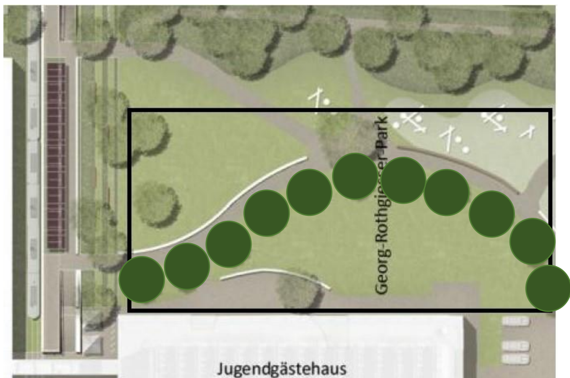
Abb. 11 Pflanzung von 11 Ersatzbäumen längs eines Weges im Georg-Rothgiesser-Park. Links die geplante Haltestelle (nach Lützwow 7).

11 Stück Eberesche Sorbus aucuparia ‚Edulis‘, Hochst., aew., 4 xv., Stu. 18 - 20 cm Die Artauswahl ist mit der Grünunterhaltung des Umweltbetriebs der Stadt Bielefeld abzustimmen.