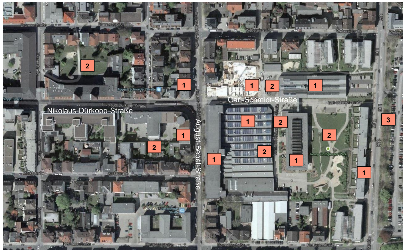
Abb. 9 Lebensraum-/ Nutzungstypen im Untersuchungsgebiet.