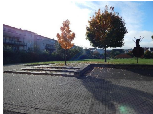
Abb. 6 Östliches Ende der Carl-Schmidt-Straße mit Blickrichtung in die angrenzende Parkanlage.