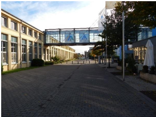
Abb. 5 Baumreihe und Grünstreifen in der Carl-Schmidt-Straße ab dem Jugendgästehaus.