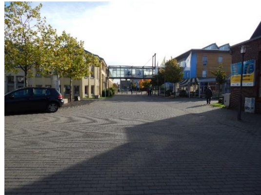
Abb. 4 Blick aus der Mitte der Carl-Schmidt-Straße in Richtung Osten