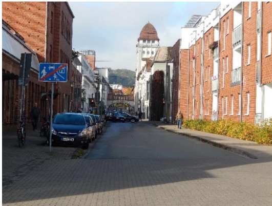
Abb. 3 Blick aus der Mitte der Carl-Schmidt-Straße in Richtung Westen