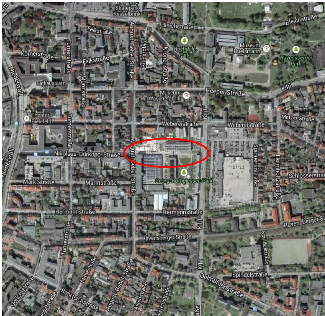
Abb. 1 Lage des Vorhabens (rotes Oval).

Die Verkehrsbetriebe moBiel GmbH der Stadtwerke Bielefeld betreiben im Rahmen des öffentlichen Personennahverkehrs auch die Bielefelder Stadtbahn. Im Zuge der Erweiterung der Fahrstrecke der Linie 4 soll diese unter Mitnutzung einer Teilstrecke der Linie 3 von der Nikolaus-Dürkopp-Straße bis in die Carl-Schmidt-Straße im Wohnquartier „Dürkopp Tor 6“ im Stadtbezirk Mitte geführt werden, was einer Erweiterung der Gleisstrecke der Linie 4 um ca. 250 m entspricht.