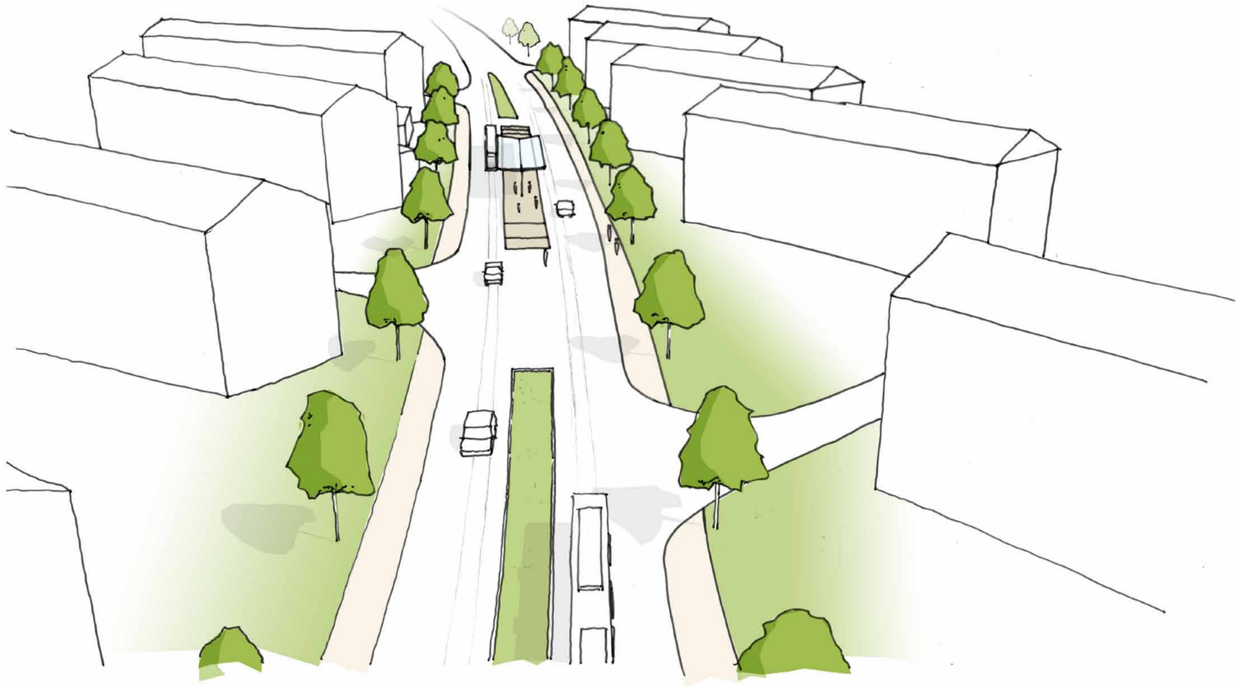
Elbeallee, Haltestelle Travestraße